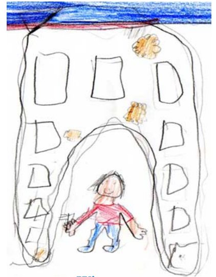
Wir putzen nach der KAI-Methode!