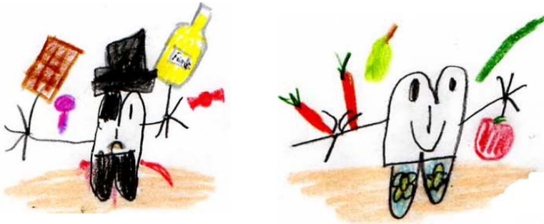
Gesunde Zähne brauchen gesundes Essen!