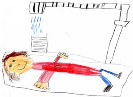
Wir haben keine Angst vor dem Zahnarztbesuch!